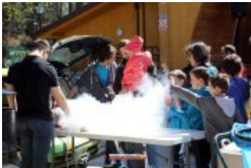
• 2017-05-01-Rodzinny Piknik Naukowy w Amfiteatrze