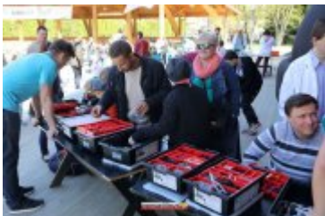
• 2017-05-01-Rodzinny Piknik Naukowy w Amfiteatrze