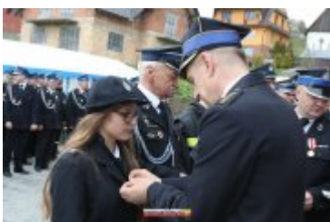
• 2017-04-30-Gminne Obchody Dnia Strażaka w Rdzawce-część 2