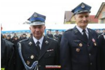
• 2017-04-30-Gminne Obchody Dnia Strażaka w Rdzawce-część 2