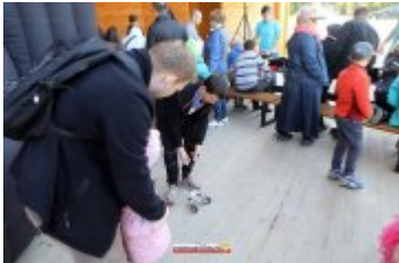
• 2017-05-01-Rodzinny Piknik Naukowy w Amfiteatrze