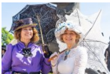
2024-06-15- Dawnej Rabki Czar cz.1