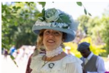
2024-06-15- Dawnej Rabki Czar cz.2