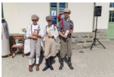
2024-06-15- Dawnej Rabki Czar cz.1