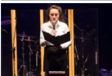
• 2017-02-18-Koncert Charytatywny pt. "Zróbmy coś dobrego"