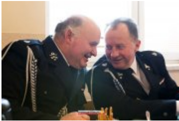
• 2017-02-19-Walne Zebranie Sprawozdawcze OSP w Rdzawce