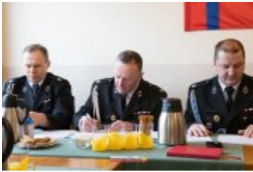
• 2017-02-19-Walne Zebranie Sprawozdawcze OSP w Rdzawce