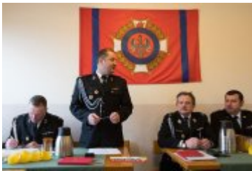
• 2017-02-19-Walne Zebranie Sprawozdawcze OSP w Rdzawce