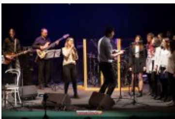
• 2017-02-18-Koncert Charytatywny pt. "Zróbmy coś dobrego"