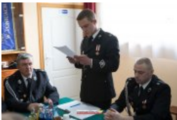
• 2017-03-05-Walne Zebranie Sprawozdawcze OSP Ponice