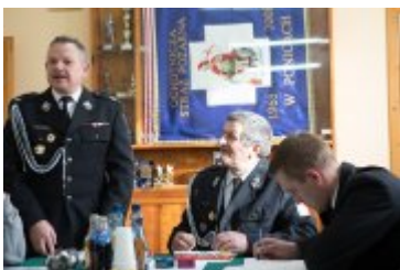
• 2017-03-05-Walne Zebranie Sprawozdawcze OSP Ponice