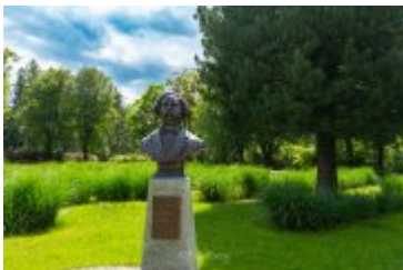
• 2024-05-29-Rabczański Park Zdrojowy pełen tysięcy kwiatów!