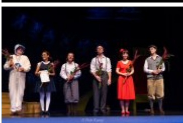
• 2024-06-14- Dawnej Rabki Czar