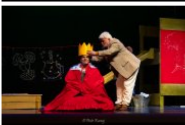
• 2024-06-14- Dawnej Rabki Czar