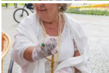
• 2024-06-16- Dawnej Rabki Czar