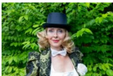
• 2024-06-16- Dawnej Rabki Czar