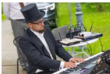
• 2024-06-16- Dawnej Rabki Czar