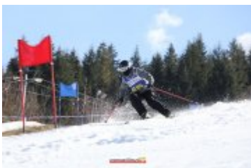
• 2017-03-03-Mistrzostwa Rabki w Konkurencjach Alpejskich