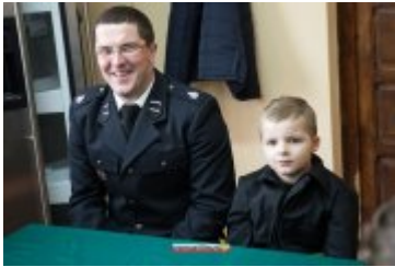
• 2017-03-05-Walne Zebranie Sprawozdawcze OSP Ponice