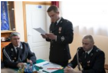
• 2017-03-05-Walne Zebranie Sprawozdawcze OSP Ponice