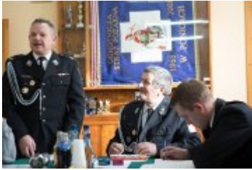
• 2017-03-05-Walne Zebranie Sprawozdawcze OSP Ponice