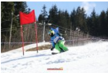
• 2017-03-03-Mistrzostwa Rabki w Konkurencjach Alpejskich