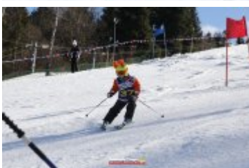
• 2017-03-03-Mistrzostwa Rabki w Konkurencjach Alpejskich