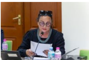
• 2024-05-28-III Sesja Rady Miejskiej w Rabce-Zdroju