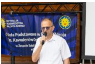
2024-06-03- Dzień Dziecka w Rabce-Zdroju cz.2