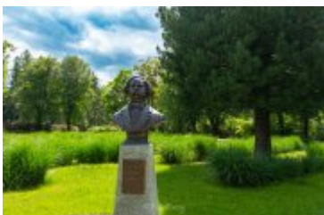
• 2024-05-29-Rabczański Park Zdrojowy pełen tysięcy kwiatów!