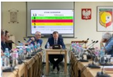
• 2024-05-28-III Sesja Rady Miejskiej w Rabce-Zdroju