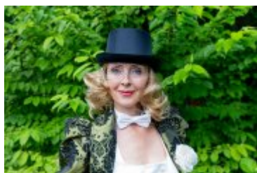
• 2024-06-16- Dawnej Rabki Czar