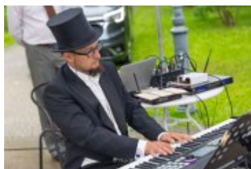
• 2024-06-16- Dawnej Rabki Czar