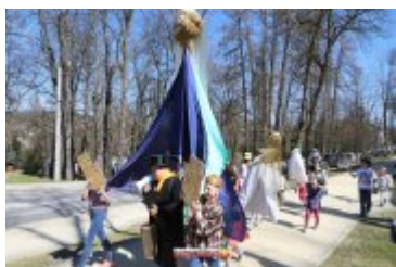
• 2017-04-01-Teatralne powitanie wiosny