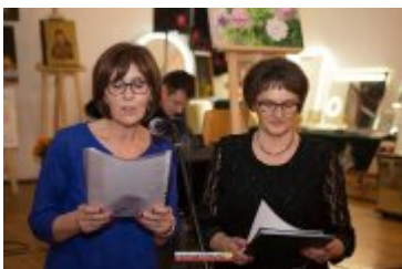
• 2017-02-11-Charytatywny Bal Walentynkowy PSONI