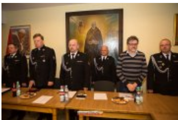
• 2017-02-12-Walne Zebranie Sprawozdawcze OSP w Chabówce