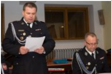
• 2017-02-12-Walne Zebranie Sprawozdawcze OSP w Chabówce