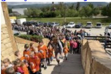
• 2024-05-08-Rabkoland otwiera bramy dla szkół i przedszkoli z gminy Rabka-Zdrój