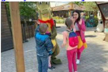
• 2024-05-08-Rabkoland otwiera bramy dla szkół i przedszkoli z gminy Rabka-Zdrój