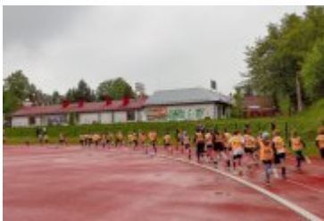
• 2024-05-07-Biegi przełajowe o Puchar Burmistrza Rabki-Zdroju