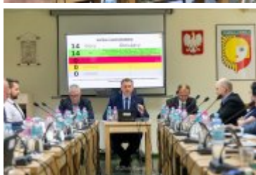
• 2024-05-17- II sesja Rady Miejskiej