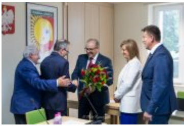
• 2024-05-07- I Sesja Rady Miejskiej w Rabce-Zdroju cz.1