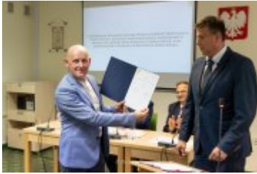
• 2024-05-07- I Sesja Rady Miejskiej w Rabce-Zdroju cz.1