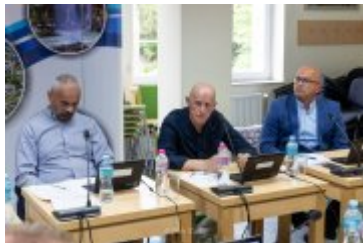
• 2024-05-17- II sesja Rady Miejskiej