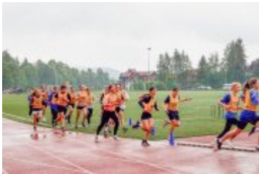
• 2024-05-07-Biegi przełajowe o Puchar Burmistrza Rabki-Zdroju