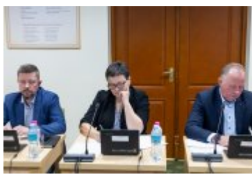
• 2024-05-17- II sesja Rady Miejskiej