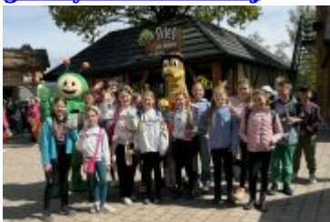
• 2024-05-08-Rabkoland otwiera bramy dla szkół i przedszkoli z gminy Rabka-Zdrój