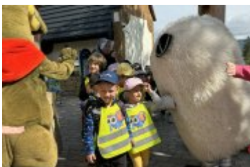
• 2024-05-08-Rabkoland otwiera bramy dla szkół i przedszkoli z gminy Rabka-Zdrój