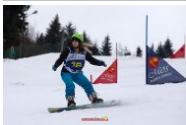
2017-02-21-Licealiada w snowboardzie na stoku Polczakówka