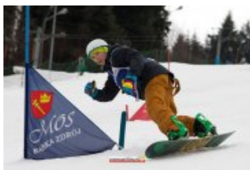
2017-02-21-Licealiada w snowboardzie na stoku Polczakówka