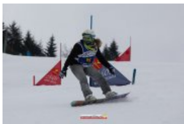
2017-02-21-Licealiada w snowboardzie na stoku Polczakówka