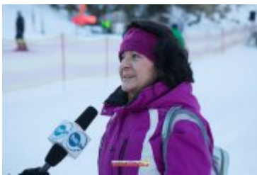
• 2017-02-15-Memoriał Marii Kaczyńskiej-dzień 1