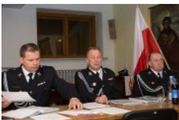
• 2017-02-12-Walne Zebranie Sprawozdawcze OSP w Chabówce