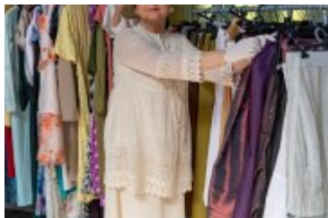
2024-06-15- Dawnej Rabki Czar cz.1