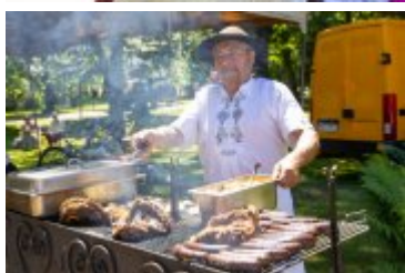
2024-06-15- Dawnej Rabki Czar cz.2