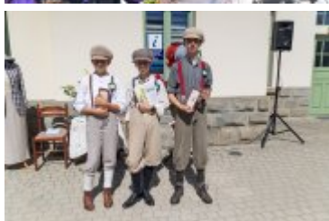
2024-06-15- Dawnej Rabki Czar cz.1