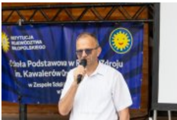
• 2024-06-03- Dzień Dziecka w Rabce-Zdroju cz.2