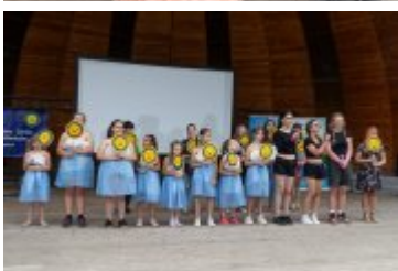
• 2024-06-03- Dzień Dziecka w Rabce-Zdroju cz.2