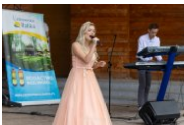
• 2024-06-03- Dzień Dziecka w Rabce-Zdroju cz.2