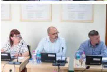
• 2024-05-28-III Sesja Rady Miejskiej w Rabce-Zdroju