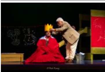
• 2024-06-14- Dawnej Rabki Czar