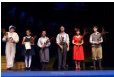
• 2024-06-14- Dawnej Rabki Czar