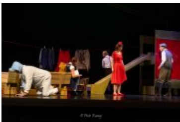
• 2024-06-14- Dawnej Rabki Czar