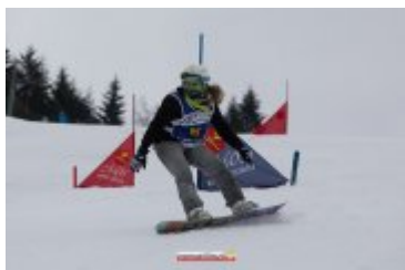
• 2017-02-21-Licealiada w snowboardzie na stoku Polczakówka