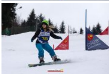
• 2017-02-21-Licealiada w snowboardzie na stoku Polczakówka