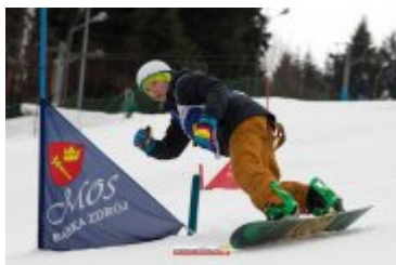
• 2017-02-21-Licealiada w snowboardzie na stoku Polczakówka