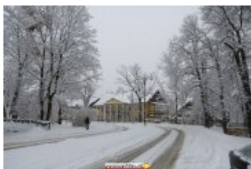
ZIMOWA SCENERIA W UZDROWISKU