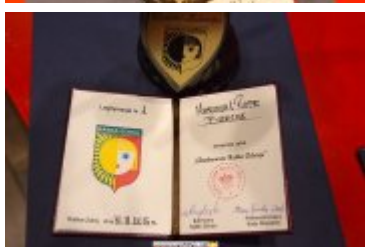
OSOBOWOŚĆ RABKI-ZDROJU - GALA W KINIE ŚNIEŻKA