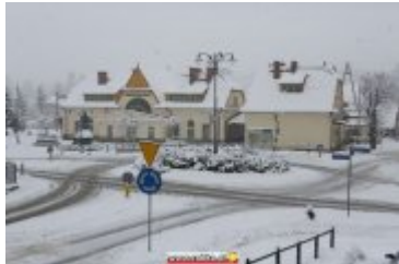
ZIMOWA SCENERIA W UZDROWISKU