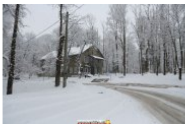
ZIMOWA SCENERIA W UZDROWISKU