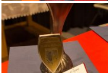
OSOBOWOŚĆ RABKI-ZDROJU - GALA W KINIE ŚNIEŻKA