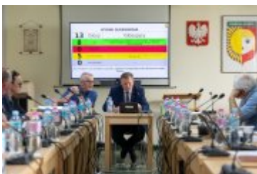
• 2024-05-28-III Sesja Rady Miejskiej w Rabce-Zdroju