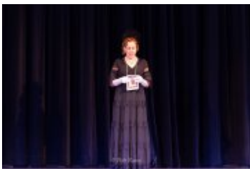
• 2024-06-14- Dawnej Rabki Czar