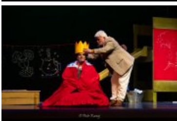
• 2024-06-14- Dawnej Rabki Czar