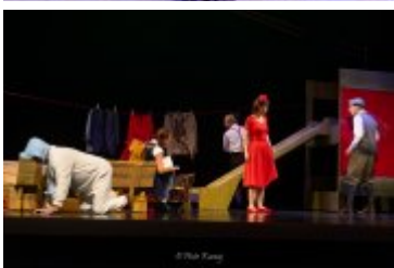
• 2024-06-14- Dawnej Rabki Czar