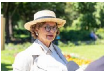
• 2024-06-15- Dawnej Rabki Czar cz.2