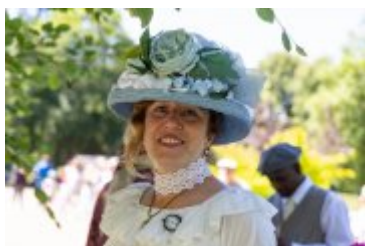
• 2024-06-15- Dawnej Rabki Czar cz.2