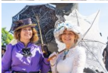
• 2024-06-15- Dawnej Rabki Czar cz.1