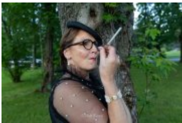
• 2024-06-15- Dawnej Rabki Czar cz.2