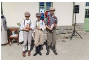
• 2024-06-15- Dawnej Rabki Czar cz.1