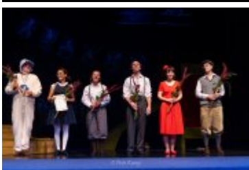
• 2024-06-14- Dawnej Rabki Czar