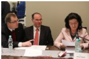
• 2017-03-16-Posiedzenie Sejmowej Komisji Ochrony Środowiska