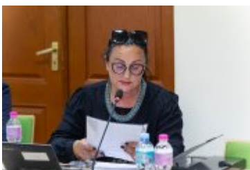
• 2024-05-28-III Sesja Rady Miejskiej w Rabce-Zdroju