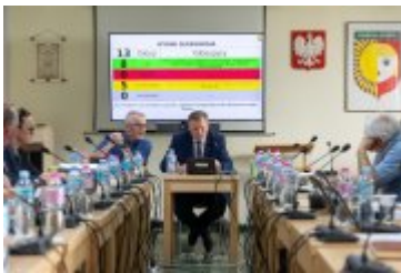
• 2024-05-28-III Sesja Rady Miejskiej w Rabce-Zdroju