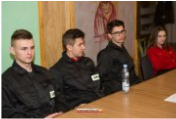
• 2017-02-12-Walne Zebranie Sprawozdawcze OSP w Chabówce