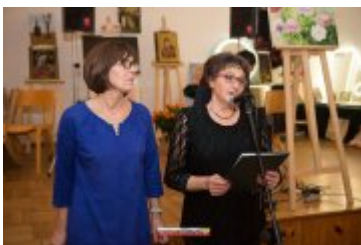
• 2017-02-11-Charytatywny Bal Walentynkowy PSONI