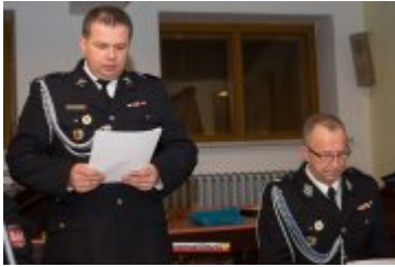
• 2017-02-12-Walne Zebranie Sprawozdawcze OSP w Chabówce