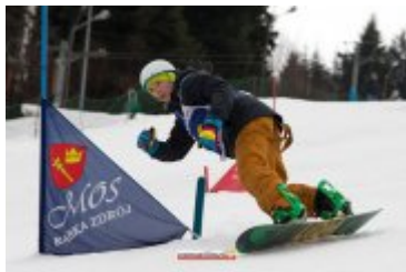
• 2017-02-21-Licealiada w snowboardzie na stoku Polczakówka