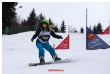
• 2017-02-21-Licealiada w snowboardzie na stoku Polczakówka