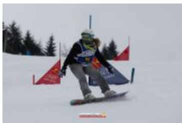
• 2017-02-21-Licealiada w snowboardzie na stoku Polczakówka