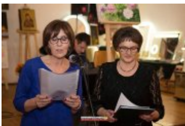
• 2017-02-11-Charytatywny Bal Walentynkowy PSONI