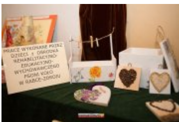
• 2017-02-11-Charytatywny Bal Walentynkowy PSONI