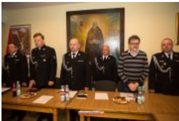
• 2017-02-12-Walne Zebranie Sprawozdawcze OSP w Chabówce