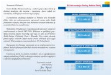
2017-03-01-10 lat rozwoju gminy Rabka-Zdrój