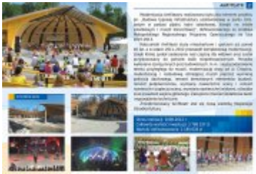
2017-03-01-10 lat rozwoju gminy Rabka-Zdrój