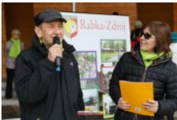
2017-02-28-IV Ogólnopolska Zimowa Senioriada na Podhalu - dzień 2 - zakończenie