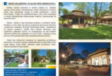
2017-03-01-10 lat rozwoju gminy Rabka-Zdrój