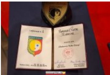
• OSOBOWOŚĆ RABKI-ZDROJU - GALA W KINIE ŚNIEŻKA