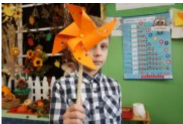
• 2019-11-18-Ogólnopolski Dzień Wiatraczka