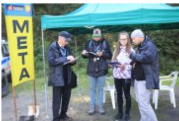
• 2019-09-22-Finał XV edycji Pucharu Szlaku Solnego