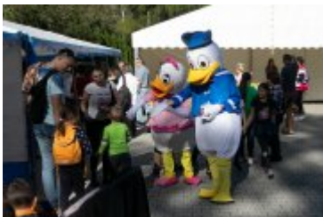
• 2019-09-22-Piknik ekologiczny w amfiteatrze