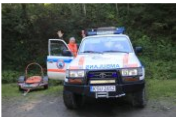
• 2019-09-22-Finał XV edycji Pucharu Szlaku Solnego