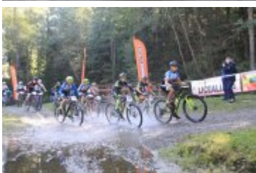
• 2019-09-22-Finał XV edycji Pucharu Szlaku Solnego