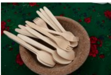
• 2019-09-22-Piknik ekologiczny w amfiteatrze