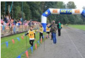
• 2019-09-25-Biegi Przełajowe o Puchar Burmistrza Rabki-Zdroju