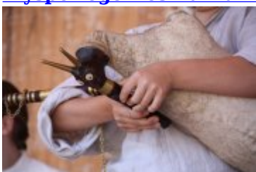
• 2019-09-22-IX Festiwal Zespołów Regionalnych Beskidu Wyspowego Beskidzka Podkowiecka