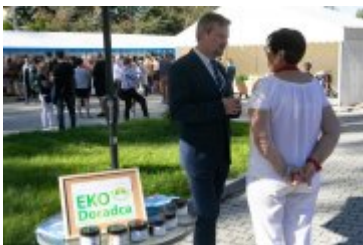
• 2019-09-22-Piknik ekologiczny w amfiteatrze