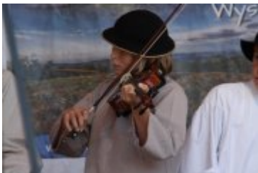
• 2019-09-22-IX Festiwal Zespołów Regionalnych Beskidu Wyspowego Beskidzka Podkowiecka