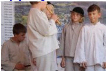
• 2019-09-22-IX Festiwal Zespołów Regionalnych Beskidu Wyspowego Beskidzka Podkowiecka