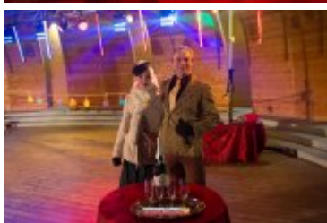
Sylwester-Powitanie Nowego 2017 Roku