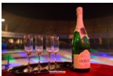
Sylwester-Powitanie Nowego 2017 Roku