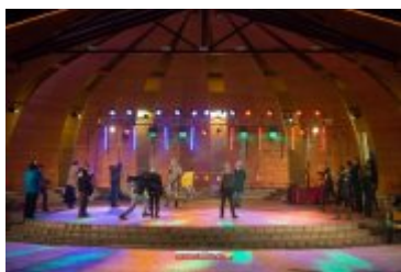
Sylwester-Powitanie Nowego 2017 Roku