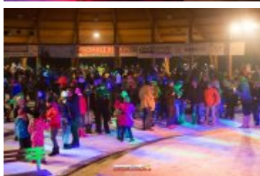
Sylwester-Powitanie Nowego 2017 Roku