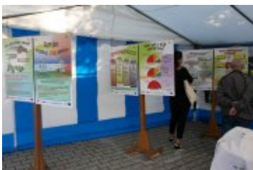
• 2019-09-22-Piknik ekologiczny w amfiteatrze