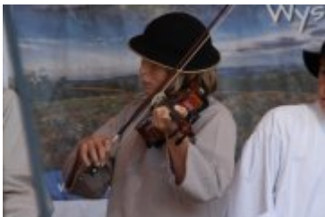
• 2019-09-22-IX Festiwal Zespołów Regionalnych Beskidu Wyspowego Beskidzka Podkowiecka