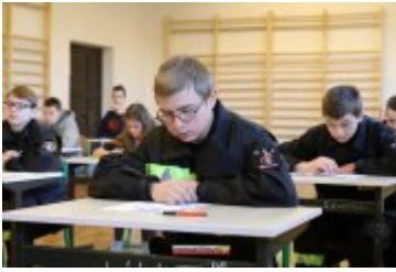
• 2017-03-17-Turniej Wiedzy Pożarniczej w Chabówce