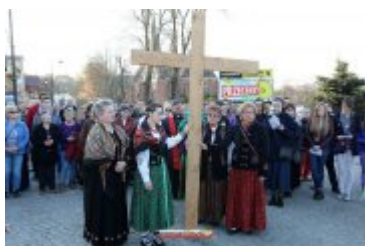
2017-03-31-Droga Krzyżowa ulicami Rabki