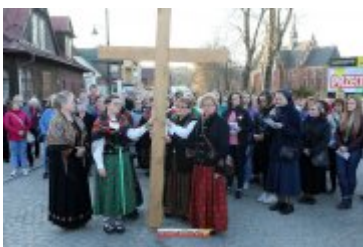
• 2017-03-31-Droga Krzyżowa ulicami Rabki