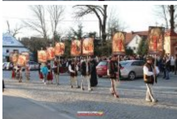
2017-03-31-Droga Krzyżowa ulicami Rabki