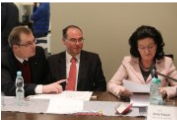
• 2017-03-16-Posiedzenie Sejmowej Komisji Ochrony Środowiska