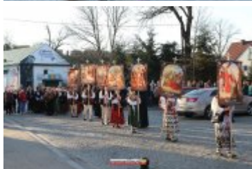
2017-03-31-Droga Krzyżowa ulicami Rabki