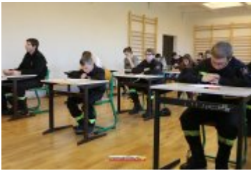
• 2017-03-17-Turniej Wiedzy Pożarniczej w Chabówce