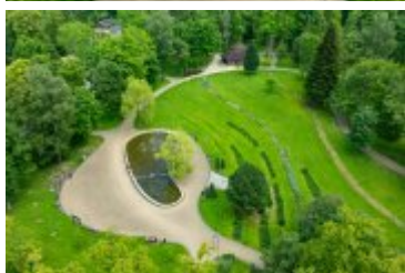
• 2024-05-29-Rabczański Park Zdrojowy pełen tysięcy kwiatów!