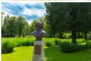
• 2024-05-29-Rabczański Park Zdrojowy pełen tysięcy kwiatów!