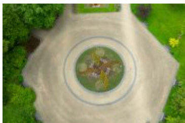
• 2024-05-29-Rabczański Park Zdrojowy pełen tysięcy kwiatów!