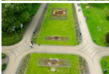
• 2024-05-29-Rabczański Park Zdrojowy pełen tysięcy kwiatów!