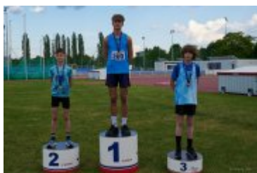
• 2024-05-27-Mistrzostwa Małopolski w dwubojach