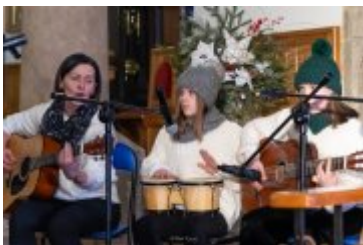
• 2024-02-02-XIII Rabczańskie Kołędowanie