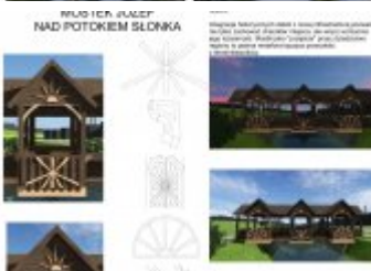
2025-07-05- Projekt "Mostki na Słońce"