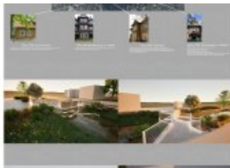
2025-07-05- Projekt "Mostki na Słońce"