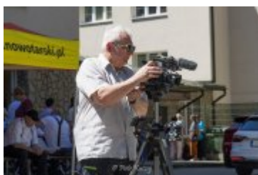
2025-07-02- 25-lecie Domu Pomocy Społecznej w Rabce-Zdroju