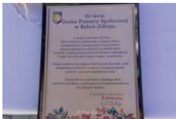
2025-07-02- 25-lecie Domu Pomocy Społecznej w Rabce-Zdroju