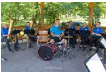
• 2025-07-06- Koncert orkiestry dętej OSP Rabka-Zdrój