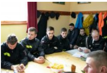
• 2020-03-08-Walne zebranie sprawozdawcze OSP Ponice