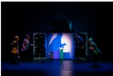
• 2020-03-06-Premiera spektaklu pt: "Bajka o Kocie w butach" w Teatrze Lalek "Rabcio"