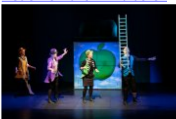
• 2020-03-06-Premiera spektaklu pt: "Bajka o Kocie w butach" w Teatrze Lalek "Rabcio"