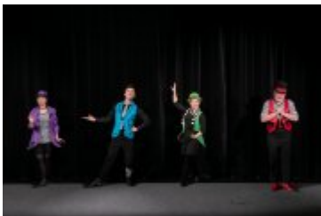
• 2020-03-06-Premiera spektaklu pt: "Bajka o Kocie w butach" w Teatrze Lalek "Rabcio"