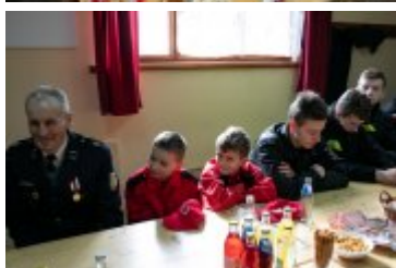
2020-03-08-Walne zebranie sprawozdawcze OSP Ponice