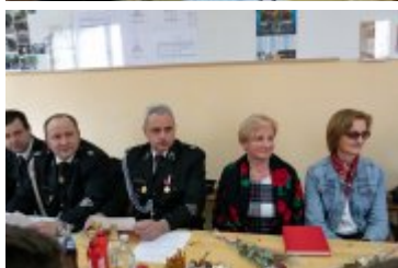
2020-03-08-Walne zebranie sprawozdawcze OSP Ponice