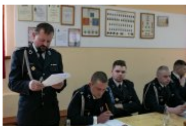
2020-03-08-Walne zebranie sprawozdawcze OSP Ponice