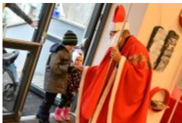
2019-12-07-Spotkanie z Mikołajem w kinie Śnieżka