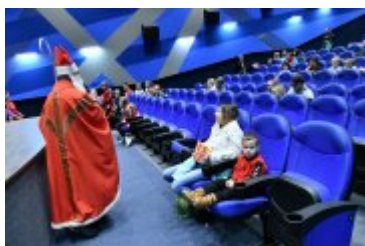
2019-12-07-Spotkanie z Mikołajem w kinie Śnieżka