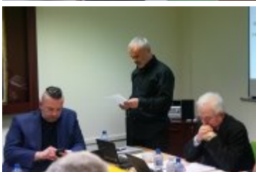
• 2019-11-27-XVI Sesja Rady Miejskiej w Rabce-Zdroju