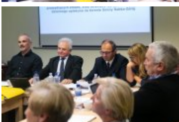
• 2019-11-27-XVI Sesja Rady Miejskiej w Rabce-Zdroju