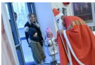
2019-12-07-Spotkanie z Mikołajem w kinie Śnieżka