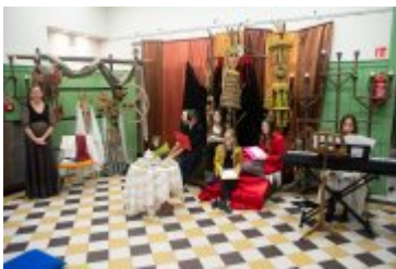
• 2019-11-28-Jesienny podwieczorek słowno-muzyczny w bibliotece