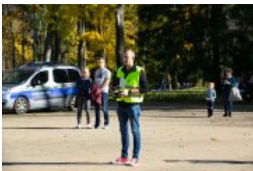
• 2019-10-13-Pokaz dronów w rabczańskim Parku Zdrojowym