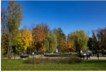
• 2019-10-13-Jesień w Parku Zdrojowym