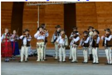
• 2019-10-12-Koncert "Majeranków" - "Młodzi dudziarze-reaktywacja tradycji"