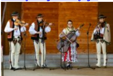
• 2019-10-12-Koncert "Majeranków" - "Młodzi dudziarze-reaktywacja tradycji"