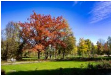
• 2019-10-13-Jesień w Parku Zdrojowym