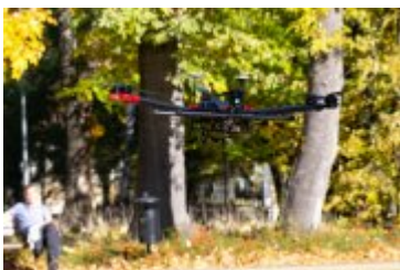
• 2019-10-13-Pokaz dronów w rabczańskim Parku Zdrojowym