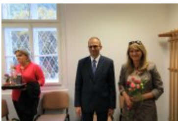
• 2019-10-15-Otwarcie nowej siedziby RUTW w willi Warszawa