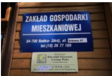
• 2019-10-15-Otwarcie nowej siedziby RUTW w willi Warszawa