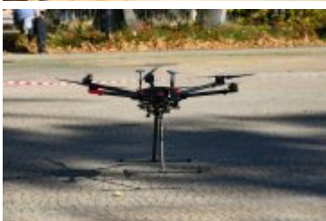
• 2019-10-13-Pokaz dronów w rabczańskim Parku Zdrojowym