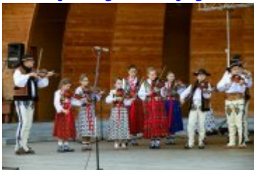
• 2019-10-12-Koncert "Majeranków" - "Młodzi dudziarze-reaktywacja tradycji"