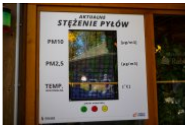
• 2019-10-13-Jesień w Parku Zdrojowym