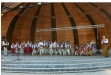
• 2019-10-12-Koncert "Majeranków" - "Młodzi dudziarze-reaktywacja tradycji"