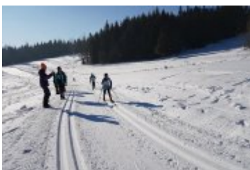
• 2019-02-01-Sukcesy rabczańskich biegaczy narciarskich