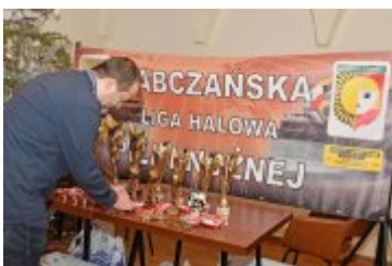
• 2019-02-02-17. edycja Rabczańskiej Ligi Halowej Piłki Nożnej