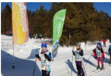
• 2019-02-01-Sukcesy rabczańskich biegaczy narciarskich