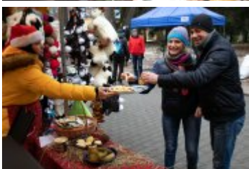
2018-12-02-II Rabczański Kiermasz Bożonarodzeniowy-cz.1