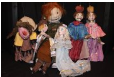
2018-12-04-Spotkanie z Rabciem