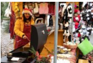
2018-12-02-II Rabczański Kiermasz Bożonarodzeniowy-cz.1