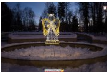
• Świąteczna iluminacja miasta