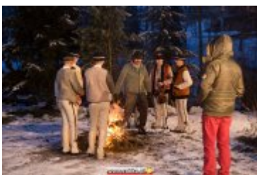
• COUNTRY, SZANTY I GÓRALE