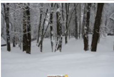
ZIMOWA SCENERIA W UZDROWISKU