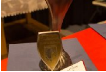
OSOLOWOŚĆ RABKI-ZDROJU - GALA W KINIE ŚNIEŻKA