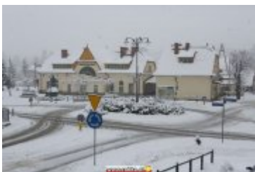
ZIMOWA SCENERIA W UZDROWISKU