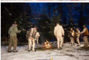
• COUNTRY, SZANTY I GÓRALE