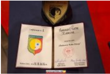
OSOLOWOŚĆ RABKI-ZDROJU - GALA W KINIE ŚNIEŻKA