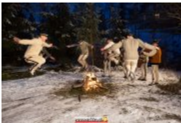
COUNTRY, SZANTY I GÓRALE