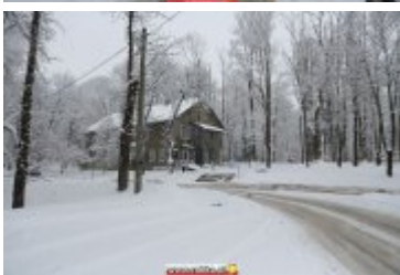
ZIMOWA SCENERIA W UZDROWISKU