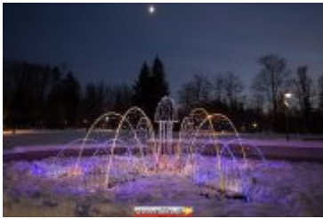
• Świąteczna iluminacja miasta