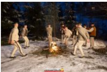
COUNTRY, SZANTY I GÓRALE