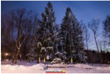
• Świąteczna iluminacja miasta