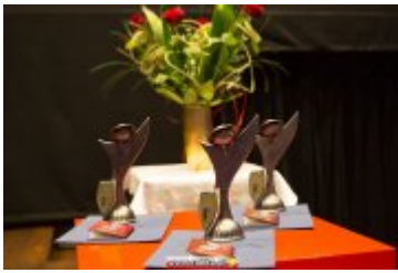
OSOLOWOŚĆ RABKI-ZDROJU - GALA W KINIE ŚNIEŻKA