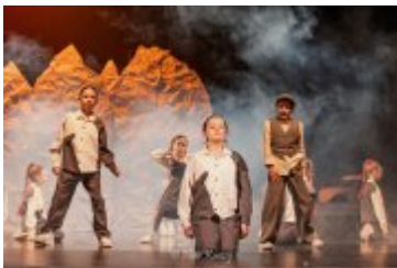
• 2025-02-22- Spektakl taneczny "Królowa Śniegu"