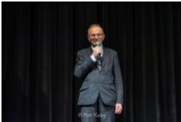
• 2025-02-22- Spektakl taneczny "Królowa Śniegu"