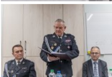
• 2025-02-22- Zebranie sprawozdawcze w OSP Rabka-Zdrój