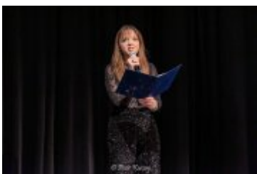
• 2025-02-22- Spektakl taneczny "Królowa Śniegu"