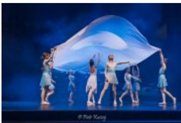
• 2025-02-22- Spektakl taneczny "Królowa Śniegu"