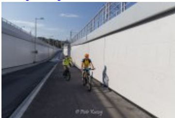
• 2025-09-05- Rowerowa wyprawa Śladami Rabczańskich Pomników Przyrody