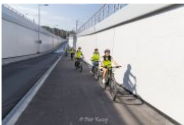
• 2025-09-05- Rowerowa wyprawa Śladami Rabczańskich Pomników Przyrody