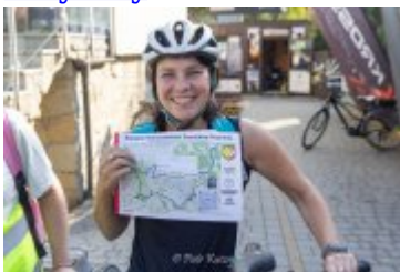
• 2025-09-05- Rowerowa wyprawa Śladami Rabczańskich Pomników Przyrody