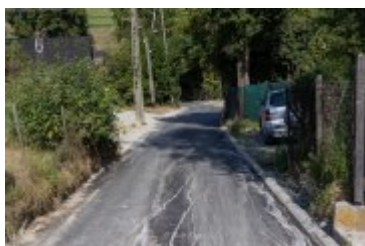
• 2024-09-06- Ulica Zakopiańska boczna "Ryplówka" po remoncie