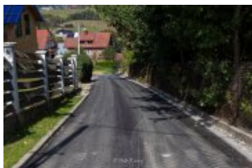
• 2024-09-06- Ulica Zakopiańska boczna "Ryplówka" po remoncie