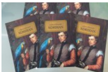
• 2024-09-09-Narodowe Czytanie - Kordian Juliusza Słowackiego