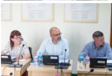
• 2024-05-28-III Sesja Rady Miejskiej w Rabce-Zdroju