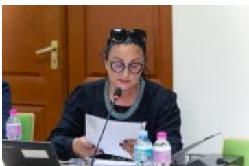
• 2024-05-28-III Sesja Rady Miejskiej w Rabce-Zdroju