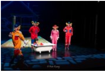
• 2024-06-03- Dzień Dziecka w Rabce-Zdroju cz.1