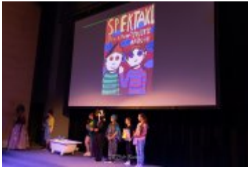
• 2024-06-03- Dzień Dziecka w Rabce-Zdroju cz.1