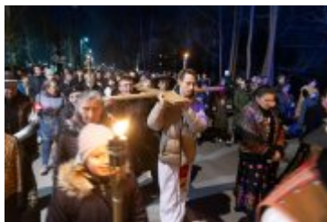
• 2024-03-22-Plenerowa Droga Krzyżowa ulicami Rabki-Zdroju