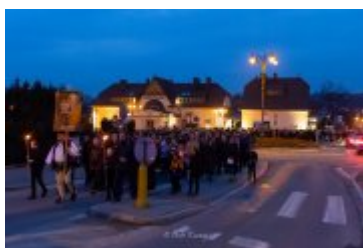
• 2024-03-22-Plenerowa Droga Krzyżowa ulicami Rabki-Zdroju