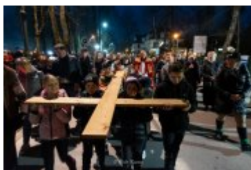
• 2024-03-22-Plenerowa Droga Krzyżowa ulicami Rabki-Zdroju