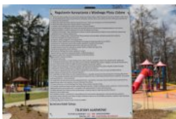
• 2023-04-21-Wodny Plac w Parku Zdrojowym otwarty