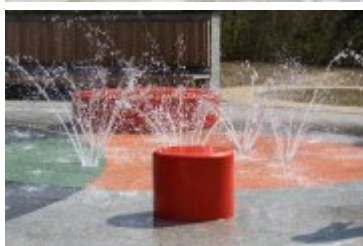
• 2023-04-21-Wodny Plac w Parku Zdrojowym otwarty