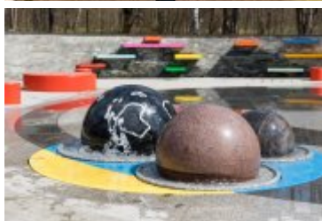
• 2023-04-21-Wodny Plac w Parku Zdrojowym otwarty