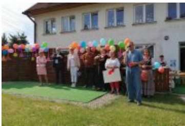
• 2022-06-24-Dzień Rodziny w przedszkolu