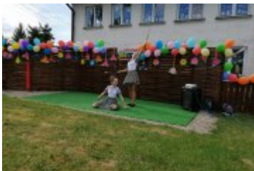
• 2022-06-24-Dzień Rodziny w przedszkolu