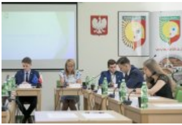
• 2022-06-24-XI sesja Młodzieżowej Rady Miejskiej