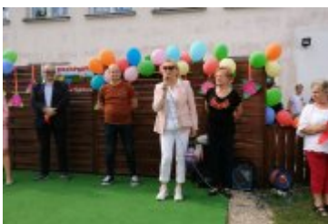
• 2022-06-24-Dzień Rodziny w przedszkolu