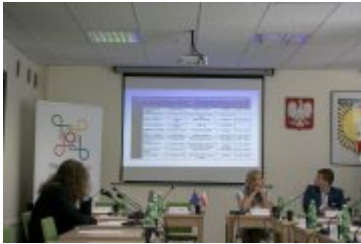
• 2022-06-24-XI sesja Młodzieżowej Rady Miejskiej