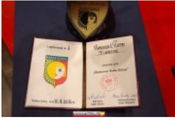
OSOLOWOŚĆ RABKI-ZDROJU - GALA W KINIE ŚNIEŻKA