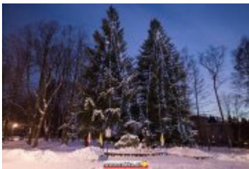
• Świąteczna iluminacja miasta