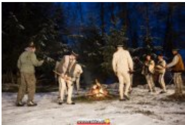
• COUNTRY, SZANTY I GÓRALE