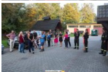
• 2016-09-20-Konferencja Thematical Network