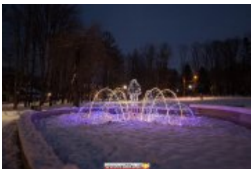
• Świąteczna iluminacja miasta