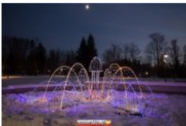
• Świąteczna iluminacja miasta