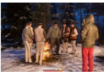
• COUNTRY, SZANTY I GÓRALE