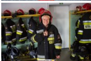
• 2016-09-20-Konferencja Thematical Network