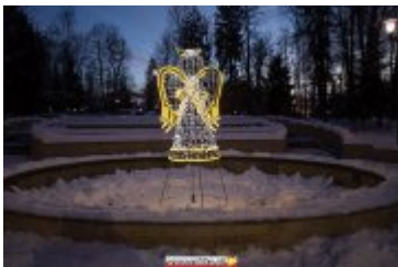
• Świąteczna iluminacja miasta