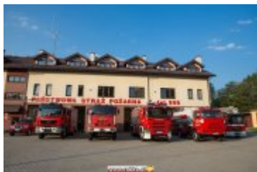
• 2016-09-20-Konferencja Thematical Network