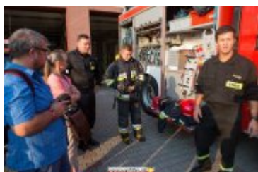
• 2016-09-20-Konferencja Thematical Network