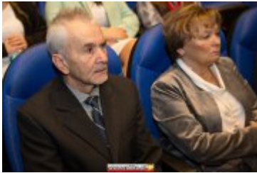
OSOLOWOŚĆ RABKI-ZDROJU - GALA W KINIE ŚNIEŻKA